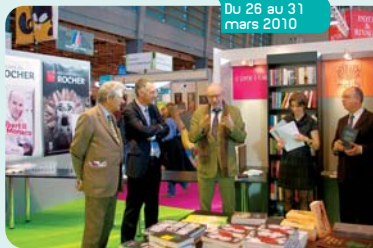
La Fondation Prince Pierre au Salon du Livre de Paris (Stand Éditions du Rocher)