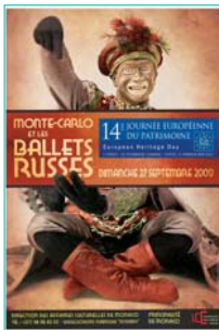
Affiche des Journées Européennes du Patrimoine 2009 à Monaco

Soulignant la tradition princière de mécénat culturel et d'accueil des arts et de la culture en Principauté, Marcel Pagnol a écrit « Ici les arts peuvent vivre encore à l'ombre de l'olivier sur le bord de la mer latine, là où l'auto-rité d'un Seul garde la liberté de tous ».