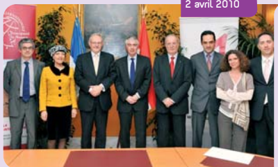
Le Gouvernement Princier et la Fondation Prince Albert II de Monaco signent une Convention-cadre de partenariat avec l'Agence Française de Développement