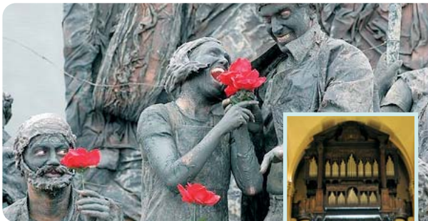
Fort Antoine saison 2010. Spectacle « STONES » par la Cie Orta-Do

Elle a également un rôle d'administration directe ou de tutelle administrative des institutions culturelles les plus importantes