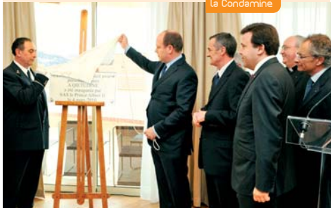
Inauguration de "A Gietidine" par SAS, le Prince Souverain