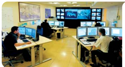
Cellule exploitation : salle de contrôle et de régulation du trafic

365 jours par an. Elle gère les carrefours à feux tricolores et les informations en temps réel affichées sur des panneaux en Principauté et en France. Elle exploite également les parcours piétonniers (escaliers mécaniques) et les zones semi-piétonnes) et assure la sécurité des tunnels routiers. Chaque information est relayée en temps réel sur le site Internet créé en interne : www.infotrafic.mc