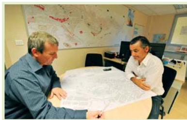
Elaboration d'itinéraire par la Cellule Maîtrise de l'espace public