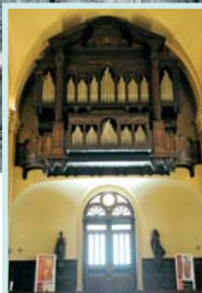
Ci-dessus : Orgue de l'Église St-Charles, où se déroulera le 5 e Festival International d'Orgue