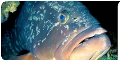
Le mérou : espèce emblématique de la Méditerranée et de la Principauté

Création d'un pôle d'échanges « Casino - Office du Tourisme » pour les bus de la TAM et de la CARF