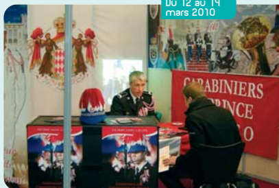
Campagne de recrutement des Carabiniers au Salon de l'Étudiant et des Métiers à Paris.