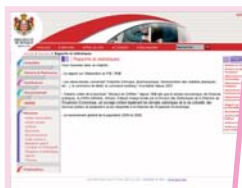
Ci-contre : Le bulletin du 4 e trimestre 2009

Pratique, précis et synthétique, le bulletin donne une vision rapide des principaux indicateurs de l'économie monégasque.