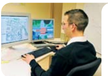
Cellule Ingénierie : optimiser les déplacements à venir

La réflexion porte également sur l'optimisation des déplacements, l'évolution du système de transport et la mise à disposition des données concernant les déplacements. Les propositions prennent en compte l'étude à l'échelle d'un site, d'un quartier, du territoire et même au-delà. Les projets soumis sont modélisés en 3D afin de permettre aux décideurs une meilleure perception des changements et améliorations.